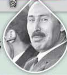
المناضل هوارى يومدين

لقد خرجنا من معركة التحرر والاستقلال لنخوض بسلاح جديد معركة أخرى، هي معركة النهضة والرقى.