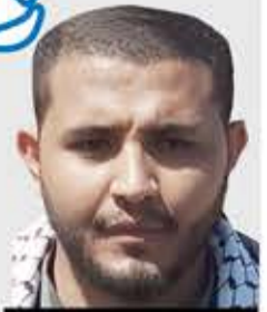
الشيخ طه أكبر