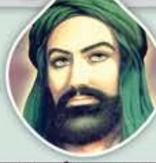
الإمام علي بن أبي طالب (عليه السلام)

البُخل والجبن والحرص غرائز شتى يجمعها سوء الظن بالله.