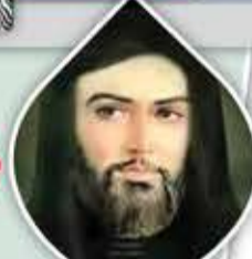
الإمام زيد بن علي (عليهما السلام)