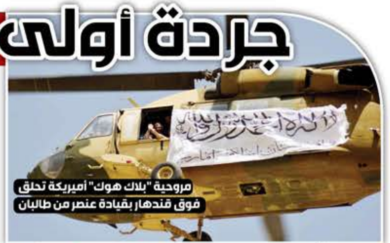
مروحية "بلاك هوك" أميركية تحلق فوق قندهار بقيادة عنصر من طالبان

استعرضت حركة طالبان في ولاية قندهار جنوبي أفغانستان معدات عسكرية أمريكية حصلت عليها. وحلقت مروحية من طراز "بلاك هوك" الأمريكية فوق المعقل الروحي لحركة طالبان، فيما وقف عناصرها على عربات الـ"هام" في "التي جري" الاستيلاء عليها.