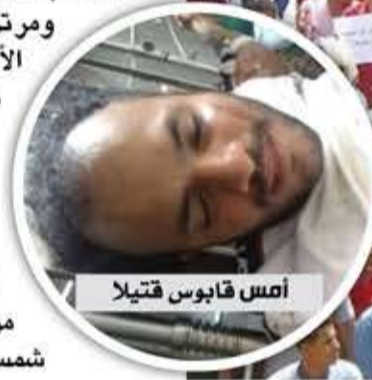
أمس قابوس قتيلا