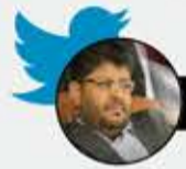
محمد علي الحوثي

تنفيذ حكم الله في قتلته الشهيد الصماد أمر أزعج الجهات التي تقف خلف الجريمة، فدفعت بأدواتها المنتمين زوراً للقضاء، ومن يدعون الإنسانية، للتشكيك في الحكم، متجاهلين ومتناسين أن الحكم مر على الدرجات القضائية كلها، وفيها من نأمنهم على العدالة وحقوق الناس، وفيما يكتبونه إساءة للقضاء والنظام.