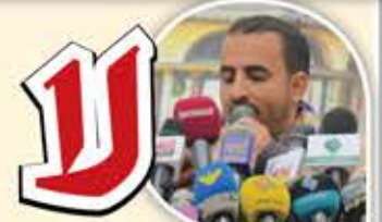
عقل بن صبر

لا «قاعدة»، في اليمن والنصر بيضاني لا «داعش»، اليوم في «ناطع» وفي «نعمان» لا شرعية للخيانة، قل للاخواني ولا شريعة لمن خالف هدى القرآن يخسى تحالف سعوضهيو بريطاني تخسى حثالات بن زايد وبين سلمان ورسالة الشعب للقاصي وللداني ما تنحني روسنا للظلم والعدوان جحافل الغزو تصلى حوم بركاني والمرتزق في جحيم الذل والخسران