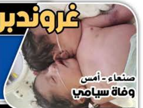
صنعاء - أمس وفاة سيامي

لندن تسرق فقراء اليمن لصالح فنادق صافيناز