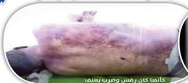
كانها كان رفض وضرب يعنف