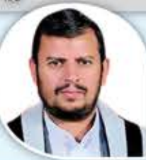
السيد القائد عبدالملك الحوثي