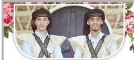
نزف أسمي آيات التهناني والتبريكات للعرسين الغاليين

لقد بلغوا ما بلغوه، لأنهم استجابوا لداعي الله استجابة حقيقية جعلتهم يفتحون على كتاب الله ويستمعون بوعي لقرينه ويتأملون في الواقع من حولهم بعيداً عن التلقين وصناعة الأفكار والتصورات التي ابتلينا بها في جبهة العمل الإعلامي والثقافي والخدمي من مثل "قل ولا تقل"، وذلك لعمرى سبب تأخرنا عن حيازة السبق الذي ظفر به العسكريون دون سواهم، أما لماذا تقدموا وتأخرنا وسارعوا حين كنا نقدم رجلاً ونؤخر أخرى؟ والسبب، أنهم اكتفوا بالقرآن وبقرينه علم الهدى الدال عليه والمرشد به والموجه إليه، إلى جانب إعمال الفكر في ما يقرؤون ويسمعون ويشاهدون، لذلك كان إيمانهم أكمل، لأنه انبنى على ضوء كتاب الله ونما وزاد بفعل انقطاع تام إليه فعرفهم سبيل الوصول إلى صراطه المستقيم وهداهم إلى اتباع الذي أنعم عليه بجعله دالاً على هذا الصراط وأخذاً بيد سالكيه كي لا تحرف خطواتهم نحو الضالين ولا تزل أقدامهم صوب المغضوب عليهم.