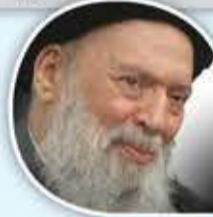
السيد محمد حسين فضل الله

قد نجعل الدين هو المشكلة أو الحل، فالإنسان عندما يحتزن التخلف يخلق المشكلة، وعندما يحتزن الوعي يمكن أن يكون الحل.