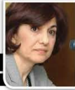
د. بثينة شعبان

المستشارة السياسية والإعلامية للرئاسة السورية.