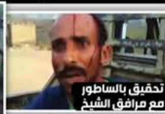
تحقيق بالساطور مع مرافق الشيخ