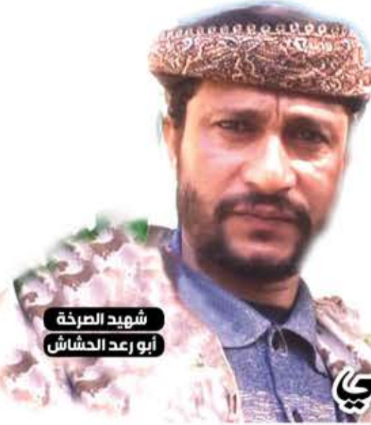
شهيد الصرخة أبو رعد الحشاش