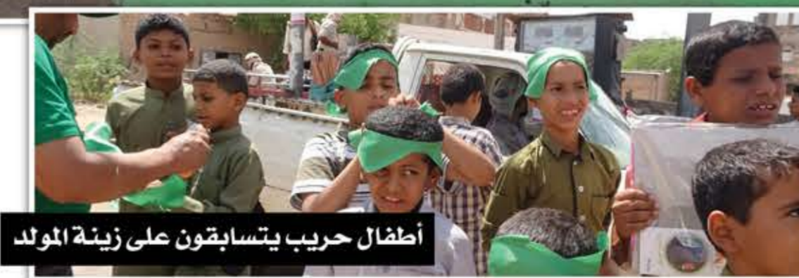
أطفال حريب يتسابقون على زينة المولد