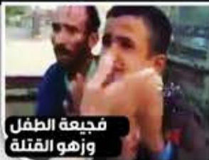
فجيرة الطفل وزهو القتلة

مراقبون قالوا إن نجاح صفقة التبادل الأخيرة في تعز بوساطات محلية فتح شهية الخونة لتضمين القوائم القادمة عناصر متهمين بوقائع اغتيال جنائنية وقعوا في قبضة صنعا خلال عمليات أمنية داخلية خارج جبهات المواجهة المباشرة مع تحالف العدوان وعملائه... وهو ما دأبت عليه قيادات الخيانة من خلط متعمد في صفقات كثيرة سابقة.