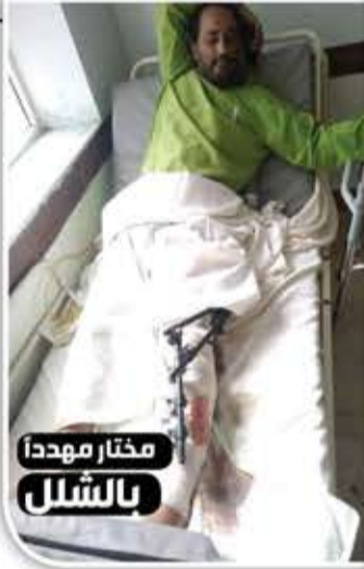
مختار مهددا بالشلل

بعد أشهر من احتجازه دون تحقيق، على ذمة محاولة اغتيال الدكتور منصر الفيشي بكمين نجم عنه إصابة الأخير، في واقعة أثارت سخط أهالي شرعب وتعز ومطالباتهم سلطة المحافظة بإنهاء سياسة "حاميتها حراميتها" في مديرية السلام المحتلة.