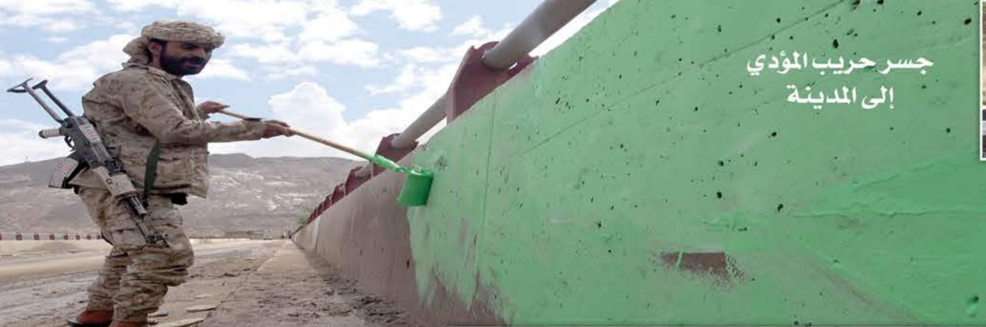
جسر حريب المؤدي إلى المدينة