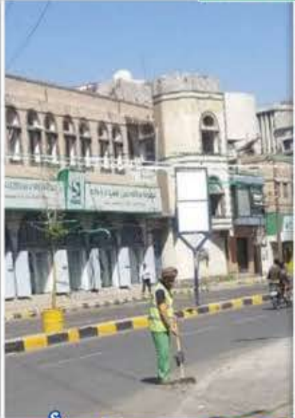
لا مروان أنعم