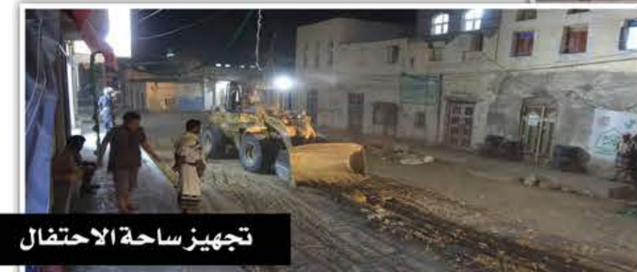
تجهيز ساحة الاحتفال

محمد صلى الله عليه وآله وسلم.. علم الهدى.. الرسول الأعظم.. خير قائد للبشرية، هكذا أصبح أبناء مديرية حريب بمحافظة مأرب يتداولون اسم رسول الله، ويستعدون للاحتفال بذكرى مولده بحفاوة كبيرة لم تشهدها المديرية والمحافظه بشكل عام على مدى عقود من الزمن، بعد أن تنضت معظم مديريات مأرب الصعداء، بدخول الجيش واللجان الشعبية وإزاحة العدوان ومرترقته عن كاهلها.