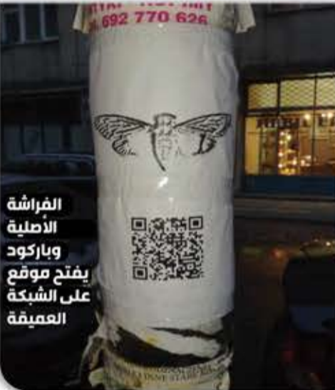
الفرشة الأصلية وباركود يفتح موقع على الشبكة العميقة

هناك الكثير من التكهنات حول ماهية سيكادا، منها: أنها أداة توظيف لوكالة الأمن القومي الأمريكية (NSA) أو المخابرات الأمريكية (CIA) والمخابرات البريطانية (MI6) أو أنها مؤامرة ماسونية، أو مجموعة من مرتزقة الإنترنت... وقد زعم آخرون أن (Cicada 3301) هي لعبة من نوع الواقع البديل، ولكن في هذه الحالة لماذا لم تظهر منظمة أو فرد ينسبها لنفسه كي يتكسب منها؟! وفي النهاية نتساءل: ما المنظمة القادرة على زرع الألغاز في أرض الواقع في 32 مدينة في 5 قارات حول العالم؟! وأين ذهب الفائزون من عام 2012 وعام 2013 بعدما فقد الاتصال بهم؟! وما هذا الكتاب الغامض؟! ومتى سنعرف معنى هذا الرمز واللغز؟!