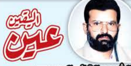
الشهيد القائد السيد حسين بدر الدين الحوثي

لا تزول البذور من آل طه قد طوى الله بالبتول، الزوالا كلما ظلمة المدى حجبتهم بزغوا كالضحى وزادوا اشتعالا هم بذار الزكاء إن دهنوها بسقت قامة وأربست غلالا كم تواروا فليل زالوا فشبوا كالمحاجين، خضرة واخضلالا وكذاك الهلال إن تم بدرأ عاد بدر التمام فيه هلالا