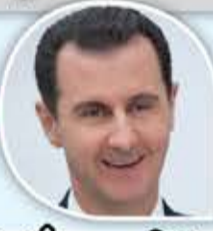
الرئيس بشار الأسد

لا ريب أن الحرب العدوانية التي تشن على سورية ولبنان واليمن تؤلم رسول الله، وعندما نتصدى لها فإننا ننتصر له.