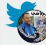
الكاتب/ نبيل هديان

السعودية 2015: قصفنا أماكن حيوية يستخدمها الحوثيون! السعودية 2021: الحوثي يقصف الأماكن الحيوية في السعودية! انتهى زمن الإدانات ، قصف بقصف وفي أسرع وقت .. هو الله .