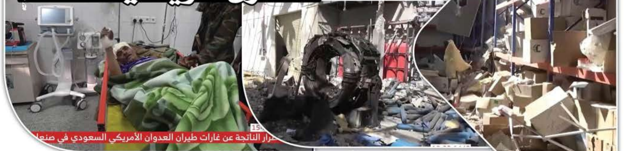
جراح الناتجة عن غارات طيران العدوان الأمريكي السعودي في صنعاء