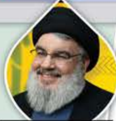
السيد حسن نصر الله

رسول الله حقق سلاماً داخلياً لا يفرضه جيش ولا شرطة، بل سلام العقول والقلوب والأرواح الذي تصنعه الثقافة والتقوى.