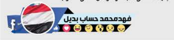
فهد محمد حساب بديل

توقف لحظة وفكر! السوداني باع جنوب السودان ، وجاء ليحمي جنوب اليمن! والجنوبي باع جنوب اليمن ، وذهب ليحمي جنوب السعودية! والإماراتي ترك جزره التي "احتلتها" إيران ، وجاء ليحتل الجزر اليمنية! والسعودي ترك ثرواته وخيرات له أمريكا و"إسرائيل" ، وجاء ليحتل ويسيطر وينهب ثروات وخيرات اليمن! واليمن مدرسة لتربية وتعليم الرجولة ومقبرة تتسع لهم جميعا! "إسرائيل" تمد إثيوبيا بأحدث شبكة للصواريخ لحماية سد النهضة من أي هجمات مصرية ، بينما مصر تحاصر غزة لحماية "إسرائيل" من أي هجمات فلسطينية! "إنها لا تعمي الأبصار ، ولكن تعمي القلوب"!