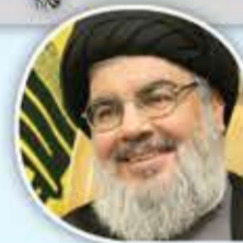
سماحة السيد حسن نصر

على المجتمع الدولي بدل إدانة الضحية في اليمن، الاستماع إلى الإرادة الشعبية للملايين.