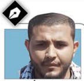
الشيخ طه أكبر

أصيل صنعاء تغمرك النشوة بتذكار مطعم شاهر الله يرزقه ومقيل الأصدقاء؟! أما الدليل الآخر فهو تصريح الأخ جباري الخطير الذي قال فيه إن الرئيس الفنان عبد ربه منصور سجين في السعودية فهو مشتاق للمقبل مع مواطنه محمد محسن عطروش وغيره أن ضمير المجرم سوف يستيقظ يوماً ما.