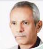
الصحفي الراحل محمد علي سعد

هناك مجموعة تجارية تنفق سنوياً مبالغ ضخمة لتفوز بكأس الدوري.. لو أنفقت هذه المبالغ على الفقراء لفازت بكأس كان مزاجها كافورا .