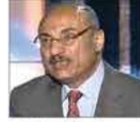
د. محمد النهاري

يرتدي ثوباً ممزقاً وحذاءً بلاستيكيًا، كل فردة لون، فردة لصبي والأخرى لفتاة. فسأله الزعيم: لماذا بصقت علي؟! فلم يجب الطفل أو يتكلم. ثم سأله: لماذا ملابسك ممزقة وحذاؤك كل فردة شكل؟! فقال له الصبي: أمي جابتهم لي من الزبالة. فسأله الرئيس: وأين أبوك؟! فرد الصبي: استشهد لما راح وياك على حرب فلسطين. هنا تجمد الرئيس قاسم برهة، ثم استشاط غضباً أخاف كل من حوله من جمهور، وصرخ بالصبي قائلاً: أريد منك تسع تفلات أخرى على وجهي حتى تصير عشراً، لأنني أستحقها!