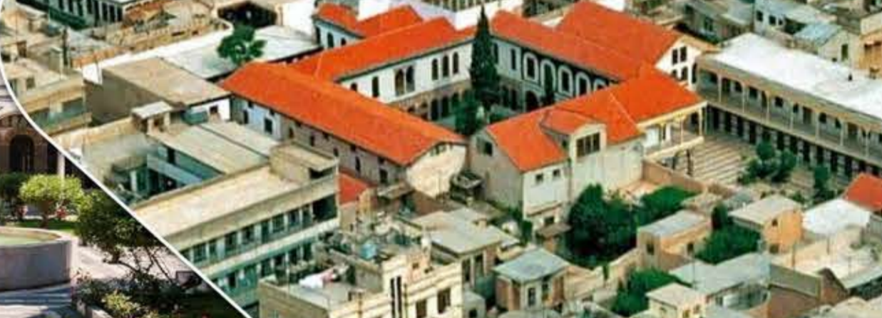
دمشق القديمة وفي الوسط يبدو مكتب عنبر