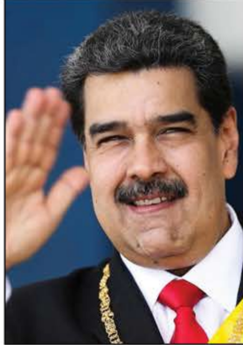
حرباً إرهابية إجرامية".

وتساءل: "هل العالم الذي نريده هو أن نشهد فيه كيف يعطى أمر من البيت الأبيض باغتيال بطل من أبطال النضال ضد الإرهاب، في كل من العراق وإيران وسورية ولبنان؟".