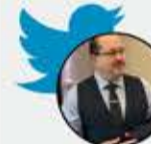
يحيى أبو زكريا

عشت في لبنان فترة من الزمن، ورغم نشأتي على لغة العرب وحديثي بها فقط دون غيرها، إلا أن اللهجة اللبنانية مفهومة لي قلبا وقالباً، وقيادي حزب الله في فيلم المالكي السعودي، يقينا ليس لبنانياً، فهذا لم يترب في لبنان قط، ثم قيادي يركب مفخخات بنظارة شمسية؟! "سوبرمان" هذا!!