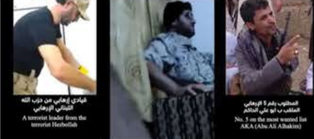
فهادي زهاني من حزب الله اللبناني الإرهابي