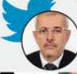
الشيخ حسين حارب

أشرف وأغلى تهمة، اتهامنا بالعلاقة مع حزب الله وسيد المقاومة، فهم إخوتنا في العروبة والإسلام والإنسانية والمقاومة. والحمد لله لم يوجهوا لقيادتنا تهمة التطبيع مع "إسرائيل" أو العمالة لأمريكا أو بريطانيا وفرنسا، ولم يظهرنا فينا من يعبد النار، ولكن أظهروا واحدا يصلي، يعني مسلم!