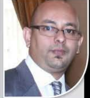
السفير محمد السادة

دخلت معركة «صنعاء» مع تحالف العدوان مرحلة جديدة من التصعيد المتبادل، مع تغيير قواعد الاشتباك، بدأ يتجلى من خلال نقض الرئيس الأمريكي جو بايدن تعهدهاتِه بإنهاء الدعم الأمريكي للحملة العسكرية السعودية على اليمن، مع تصعيد تحالف العدوان وتيرة غاراته الجوية على المدن اليمنية، وفي مقدمتها «صنعاء»، التي تواجه التصعيد بتصعيد أكبر ترضخ فيه قواعد اشتباك جديدة، تشمل توسيع جغرافيا بنك الأهداف العسكرية والحيوية في عمق دول العدوان، وهو ما أظهرته العملية العسكرية النوعية لقوات «صنعاء» المسماة «عملية السابع من ديسمبر»، والتي طالت جملة من الأهداف الحساسة على امتداد الرقعة الجغرافية للسعودية.