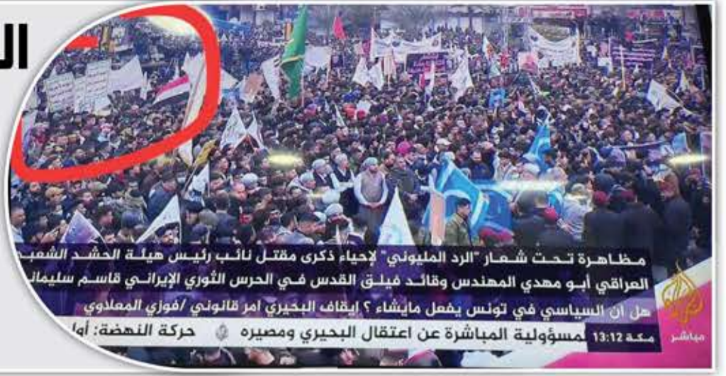
مظاهرة تحت شعار «الرد المليوني» لإحياء ذكرى مقتل نائب رئيس هيئة الحشد الشعبي العراقي أبو مهدي المهندس وقائد فيلق القدس في الحرس الثوري الإيراني قاسم سلیماني. هل أن السياسي في تونس يفعل ما يشاء؟ إيقاف البحري أمر قانوني / فوزي المعلاوي معه 13:12 لمسؤولية المباشرة عن اعتقال البحري ومصيره حركة النهضة: أها

أحييت حشود مليونية في العاصمة العراقية، بغداد، أمس، مراسيم إحياء الذكرى السنوية الثانية لاستشهاد القائد السابق لقوة القدس، الشهيد قاسم سلیماني، والنائب السابق لرئيس هيئة الحشد الشعبي العراقي أبو مهدي المهندس.