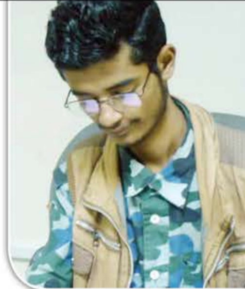
اليدوية، وحدة الفنون التشكيلية والشعبية، وحدة الإنشاد والإبداع المسرحي، الوحدة الإعلامية.

◆ من يقوم بدعم وتمويل أنشطة المركز بشكل عام؟ – التمويل والدعم شخصي بنسبة 80%.