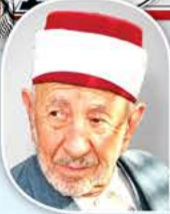
الدكتور الشهيد محمد البوطي

تري أي قيمة تبقى لحياة تضمحل فيها الضوارق بين الحق والباطل؟ وأي فائدة تبقى لعلم لا يملك أن يصنّفهما ويضع كلا منهما في المكان اللائق.