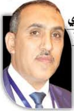
عبدالله صبري سفير بلادنا في سورية

سبع سنوات واليمن مستباح الدم والأرض. مئات المذابح وآلاف الضحايا، القتل بالجملة، وكل شبر في أرض اليمن مرتع للتوحش، غارات جوية لا حدود لها، وجيوش من المرتزقة لا ينقطع مددها، وغطاء سياسي غير مسبوق، وآلة إعلامية هي الأوسع والأحدث، وأموال لو أنفق الربع منها، لعمت التنمية والنهضة كل ربوع الوطن العربي. غير أن اليمن سجل أسطوره من جديد كما كان مقبرة الغزاة عبر التاريخ. سبع سنوات ولما يستفك الضمير العالمي وما يسمى بالمجتمع الدولي، بل على العكس من ذلك، فهذا العالم المنافق قد تجرد من كل القيم التي كان يتلفع بها في أزمت وحروب أخرى. والأشد مرارة أن هذا التواطؤ انسحب على الرأي العام في الغرب، الذي عهدناه فاعلاً ومؤثراً في كل ما يتعلق بالحريات وانتهاكات حقوق الإنسان، إلا أنه سقط في امتحان اليمن.