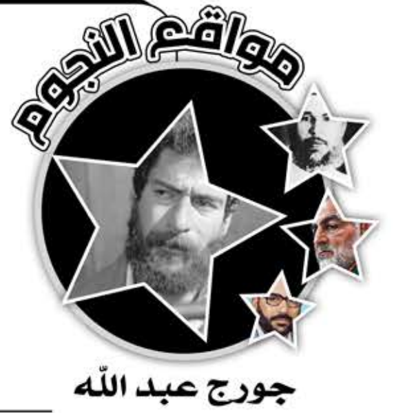
جورج عبد الله

الشرطة الفرنسية بالصدفة في مدينة ليون، وعثر بحوزته على جواز سفر جزائري مزور، ليتم اعتقاله. وبعد مداومتها لشفته اكتشفت الشرطة هويته الحقيقية. عام 1987، حكم عليه بالسجن المؤبد بتهمة قتل الضابط الأمريكي وسكرتير السفارة «الإسرائيلية»، وكذلك لتورطه في محاولة اغتيال القنصل الأمريكي في ستراسبورغ حينها. عام 1999 أكمل الحد الأدنى من عقوبة السجن المؤبد، لكن طلبات الإفراج المشروط رفضت. وفي عام 2003، منحته المحكمة الإفراج المشروط، إلا أن أمريكا اعترضت على قرار المحكمة. فقدم وزير العدل الفرنسي حينذاك استئنافاً ضد الإفراج. في عام 2013، تم الحكم بالإفراج عنه بشرط ترحيله من فرنسا. فاعترضت الخارجية الأمريكية على إطلاقه. وحين حل الموعد المقرر لعودته إلى لبنان، رفض وزير الداخلية الفرنسي التوقيع على ورقة ترحيله، فأجلت المحكمة النظر في دعواه إلى 10 شباط/فبراير القادم.