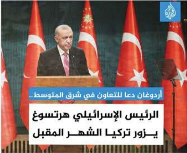
أردوغان دعا للتعاون في شرق المتوسط.. الرئيس الإسرائيلي هرتسوغ يزور تركيا الشهر المقبل

بعض أبنوا الإعلام المأجورة من الإخوان تباهاوا بأردوغان أنه «الملمح» و«المنقذ» و«خليفة المسلمين»... الخ، ها هو اليوم يستقبل الرئيس الصهيوني ليوطدوا «علاقاتهم الطيبة»!