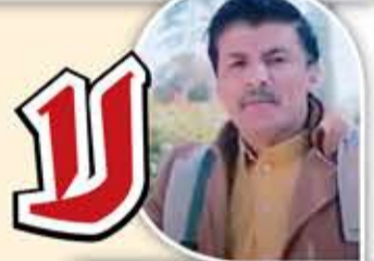
ابونا جع المنبهي

لا عاد تنديدكم يا شعبنا ناديت عين العمالة تشوف الطالب المطلوب غارات وحصار بر وبحر كم عانيت صبرت للجور والوجاع صبر ايوب ثامن سنة دمروا، كم منشأة كم بيت واسواق وسجون امام العالم المقلوب واليوم يا شعب باجناح الثقة عليت بشائر النصر ذي ردت بصر يعقوب إيمان راسخ بقوة ربي استقويت وبفضله اليوم صار الضارب المضروب