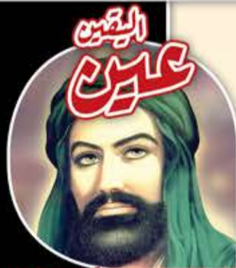
الإمام علي بن أبي طالب (عليه السلام)