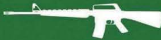
للصان أحمد جحاف