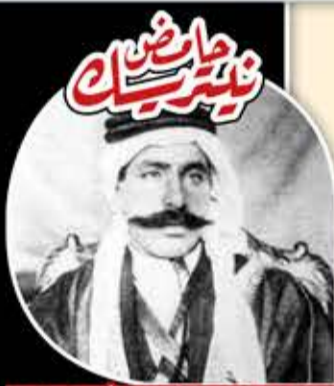
سلطان باشا الأطرش