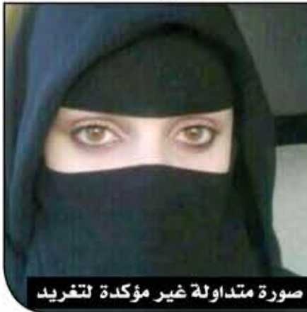
صورة متداولة غير مؤكدة لتغريد