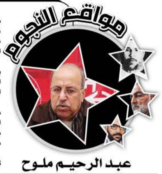
عبد الرحيم ملوح

أحد أبرز قيادات الثورة الفلسطينية، ومن مؤسسي الجبهة الشعبية لتحرير فلسطين. تميز بكفاحيته العالية، وبروح التضحية التي تجسدت بعطائه الكبير في مجالات العمل والمهام التي كلف بها دون ترفع أو تردد. ولد عبد الرحيم محمود ملوح عام 1945 في يافا. التحق بجيش التحرير الفلسطيني في العراق عام 1965، ثم انتسب إلى حركة القوميين العرب عام 1966. انتسب إلى الجبهة الشعبية لتحرير فلسطين منذ تأسيسها عام 1967، وانخرط مباشرة في العمل العسكري بالأردن، حيث شارك في العديد من الدورات العسكرية والأمنية والنظرية في كل من موسكو وبغداد. انتخب لعضوية المكتب السياسي للجبهة عام 1973، وتولى العديد من المسؤوليات، أبرزها: