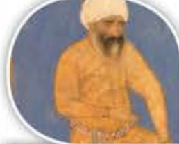
المتصوف ابن عطاء الله السكندري