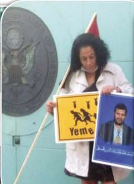
الناشطة كوني دي ويت - تشيلي