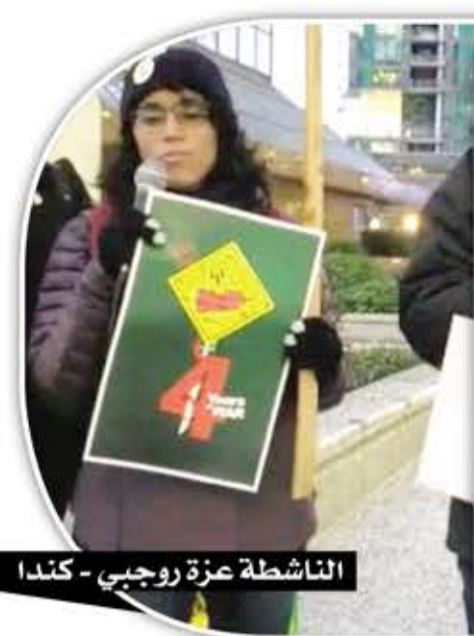
الناشطة عزة روجبي - كندا