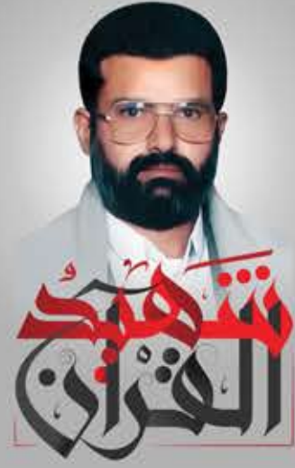
الذكرى السنوية للشهيد القائد السيد حسين بدر الدين الحوثي 2022 - 1443

ما نعيشه اليوم من عزة وكرامة هي بفضل الله أولاً ثم بفضل الشهيد القائد رضوان الله عليه الذي قدم روحه الطاهرة في سبيل الدفاع عن عزة وكرامة هذه الأمة.