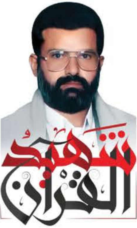
الذكرى السنوية للشهيد القائد السيد حسين بدر الدين الحوثي