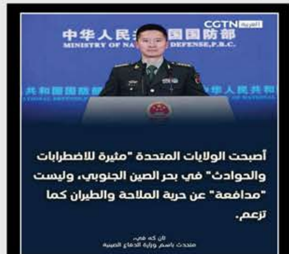
أصبحت الولايات المتحدة "ميرة للاضطرابات والحوادث" في بحر الصين الجنوبي، وليست "مدافعة" عن حرية الملاحة والطيران كما تزعم.