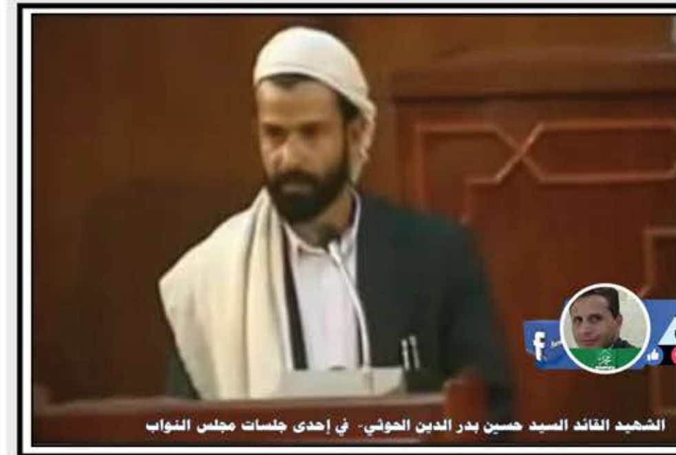
الشهيد القائد السيد حسين بدر الدين الحوثي - في إحدى جلسات مجلس النواب

«أنا لن أعدكم بشيء، لكني أعدكم ألا أملككم في باطل» . الشهيد القائد حسين بدر الدين الحوثي، رضوان الله عليه.