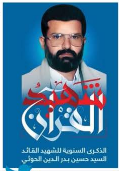
الذكرى السنوية للشهيد القائد السيد حسين بدر الدين الحوثي

رغم الحروب التي لم تتوقف لقرابة 18 عاما، بقي الشهيد القائد ومشروعه العظيم، وتلاشي كل قاتليه! أفلا يتفكرون!؟