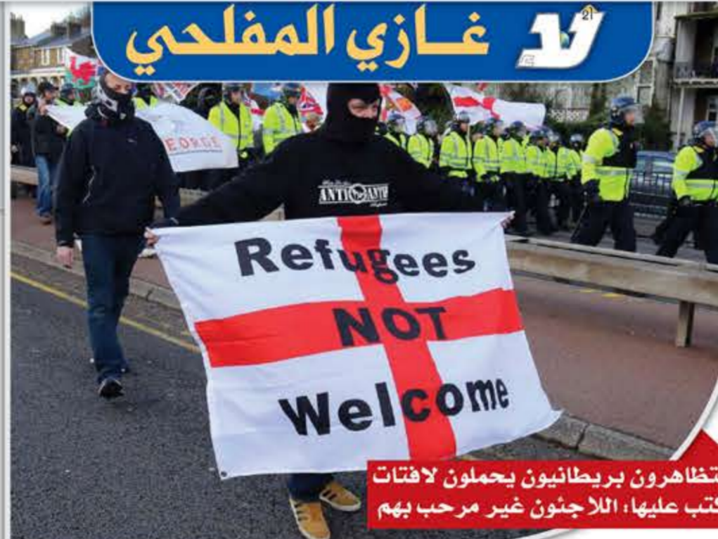
متظاهرون بريطانيون يحملون لافتات كتب عليها، اللاجئون غير مرحب بهم

بالنسبة للعديد من النخب الأمريكية البيضاء، فإنه إذا أرادت الولايات المتحدة الأمريكية البقاء على قيد الحياة، يجب عليها الدمج الدقيق لسياسات التمييز العنصري والثقافي في الشؤون الداخلية والدبلوماسية للولايات المتحدة، من أجل بناء نظام هرمي للمجموعات العرقية والحضارات. ويتجسد هذا الترتيب الهرمي في سياسة التمييز المؤسسي والثقافي ضد السود والأقليات الأخرى في السياسة والاقتصاد والثقافة والتعليم وغيرها.