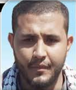
الشيخ طه أكبر الحيرة

بين مد وجزر يتقلب الكثير منا وتأتي على أقدنا الأحداث والمواقف الإيجابية من قبل الصف الذي يرى نفسه منه والذي يرى ذاته جزءاً لا قيمة له إلا فيه ثم تتبع تلك المواقف والأحداث مواقف وأحداث سلبية تدخل هذا الإنسان في حيرة مضللة وفي شكوك مضنية فلا هو يتشجع ليقف موقفاً معارضاً وهل يقف العاقل ضد نفسه! ولا هو يتحمل أن يظل ساكناً طوال الوقت وأني له ذلك وله شعور وإحساس وحياة وحركة.