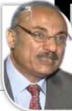
أ. د. محمد أحمد النهاري

لما يزل أبو الطيب أحمد بن الحسين الجعفي الكوفي (303 - 354 هـ) يتميز بين عباقرة العربية مستقراً يقض مضاجع الأدباء بشعره الذي يسهر الخلق جراه ويختصم. وهو أبو الطيب معجز في ذاته، فهو عاقل حكيم، مجنون في خيال، نبئ وكافر، شاعر وولي، ملك وشيطان، تضح من شعره البراءة والتلقائية وتسطو كلماته كأي خارجي لا يمتشق شعره غير صيف والغ في الدماء، طفل كبير يفقد حنو الأمومة، صلوك يرفض ذوقه في حلية خصيم مبین، عندما تسمع شعره توليه "جمعك" وتحتشد للقيام له كأنه ملك ذو سلطان عظيم، تذك له الجبا.