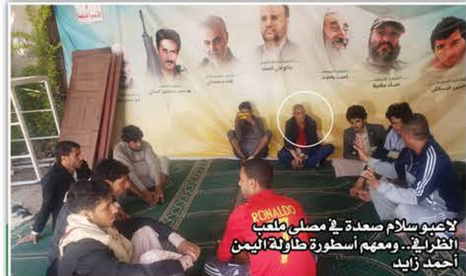
لاعبو سلام صعدة في ملعب الظلال... ومعهم أسطورة طولة اليمن أحمد زايد

بوزارة الشباب والرياضة بالتعاون مع إدارة الأنشطة المدرسية بوزارة التربية والتعليم. وفى التدشين، الذى حضره وكيل قطاع الشباب عبدالله الرازى ووكيل قطاع الرياضة على حسين هضبان، حث وزير الشباب والرياضة، المشاركون على الاستفادة من برنامج اللقاء لتحقيق الفائدة المنشودة ونقل معارفهم للطلبة لتطبيقها على الواقع.