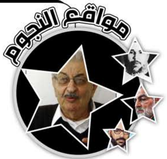
محمد داوود عدة (أبو داوود)

الإفراج عن المعتقلين الفلسطينيين في سجون الأردن، وحكم عليه ومرافقيه بالإعدام، وأفرج عنه عقب زيارة قام بها الملك حسين إليه في سجنه. في بيروت، عُيّن قائداً عسكرياً لمنطقة بيروت الغربية، وخاض حرب العامين 1975 و 76 في لبنان. اختلف مع رئيس منظمة التحرير، ياسر عرفات، عام 78، بسبب قبول عرفات باتفاق وقف إطلاق النار مع الاحتلال الصهيوني آنذاك. بعد الخروج من بيروت كان وسيطاً في الخلاف الذي دب داخل حركة فتح عام 83 بين «أبو موسى» وياسر عرفات، وانتهى بخروج عرفات من طرابلس عام 84. عام 1999م، نشر كتابه «فلسطين من القدس إلى ميونخ»، الذي يتحدث فيه للصحافي الفرنسي جيل دو جوشيه، عن رحلته من طفولته وعلاقته بمنظمة أيلول الأسود والعمليات التي خطط لها وشارك في تنفيذها. انتقل إلى دمشق وبقي حتى وفاته يوم 3 تموز/ يوليو 2010.