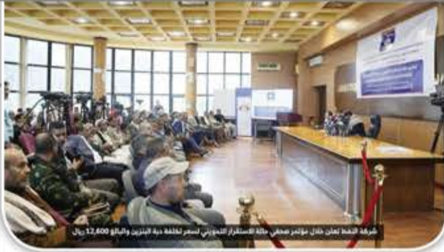
خرق النفط تعز خلال مؤتمر صحفي، طيلة الاستمرار التموييني اسعر ثلاثة دية البنزين والبنالو 12,600 ريال

المعلن عنه هدنة مؤقتة وليس وقفا للعدوان ورفع الحصار.