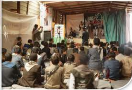
تستكمل بقية المحافظات استعداداتها للتدشين.

وأكد سيد الثورة في كلمته خلال التدشين أن ميزة النشاط التعليمي بالمراكز الصيفية، أنه يأتي في إطار التوجه التحرري العملي الشامل لأبناء الشعب اليمني. وتوزعت آلاف المراكز الصيفية في مختلف المحافظات الحرة لاستقبال أعداد كبيرة من الطلاب المقبلين عليها، رغم الحملات المسعورة التي تشنها عليها ماكنة تحالف العدوان الأمريكي السعودي ومرتزقته الإعلامية.