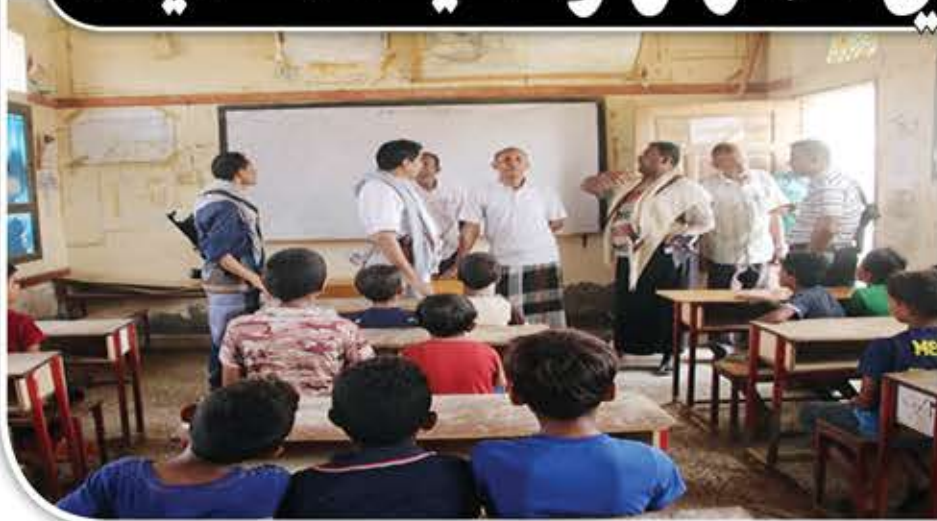
خلال العلم والمعرفة. وأوضح أن "مركز الشهيد الصماد الصيفي" يستوعب ما يقارب 300 طالب من أبناء منتسبي القطاع والأحياء المجاورة.

لإعداد جيل مسلح بالثقافة القرآنية والعلم النافع والمعارف في شتى العلوم وتصحيح المفاهيم المغلوطة. في العاصمة صنعاء دشنت القطاع النسائي واللجنة الفرعية للمدارس الصيفية للطالبات بمديرية أزال، أمس الأحد أنشطة الدورات الصيفية. من جانبه دشنت قطاع الأمن والشرطة بوزارة الداخلية في اليوم ذاته، "مركز الشهيد الصماد الصيفي" بالتنسيق مع اللجنة العليا للمراكز الصيفية تحت شعار "علم وجهاد". وأكدت قيادة وزارة الداخلية، أن العدو ينزعج من الأنشطة والبرامج والدورات الصيفية، كونها ميداناً للبناء المعرفي والعلمي، ولإدراكه أن تطور الأمة يأتي من