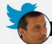
استكوا وبس، أفضل من الإهانات!!

بالنسبة لي لو كنت الحكومة السورية أو امرها بيدي، أقل شي.. أقل شي، أكون اسكت ولا أعلن عن الهجمات «الإسرائيلية»، وازيد اكذب واعلن التصدي لها، وفي نفس الوقت أعلن مقتل أشخاص!