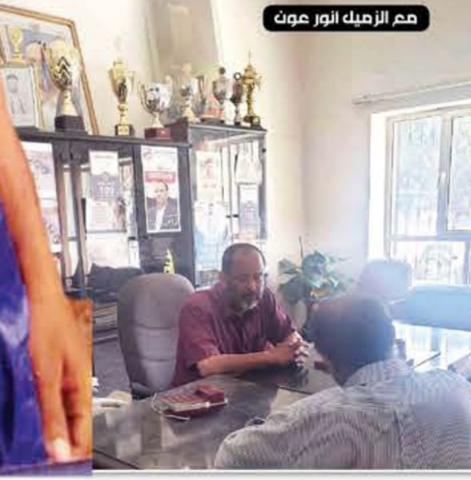
عم الزميك نور عون

الكبار في تلك الفترة وشعرت أنني لن أستطيع مزاحمتهم.