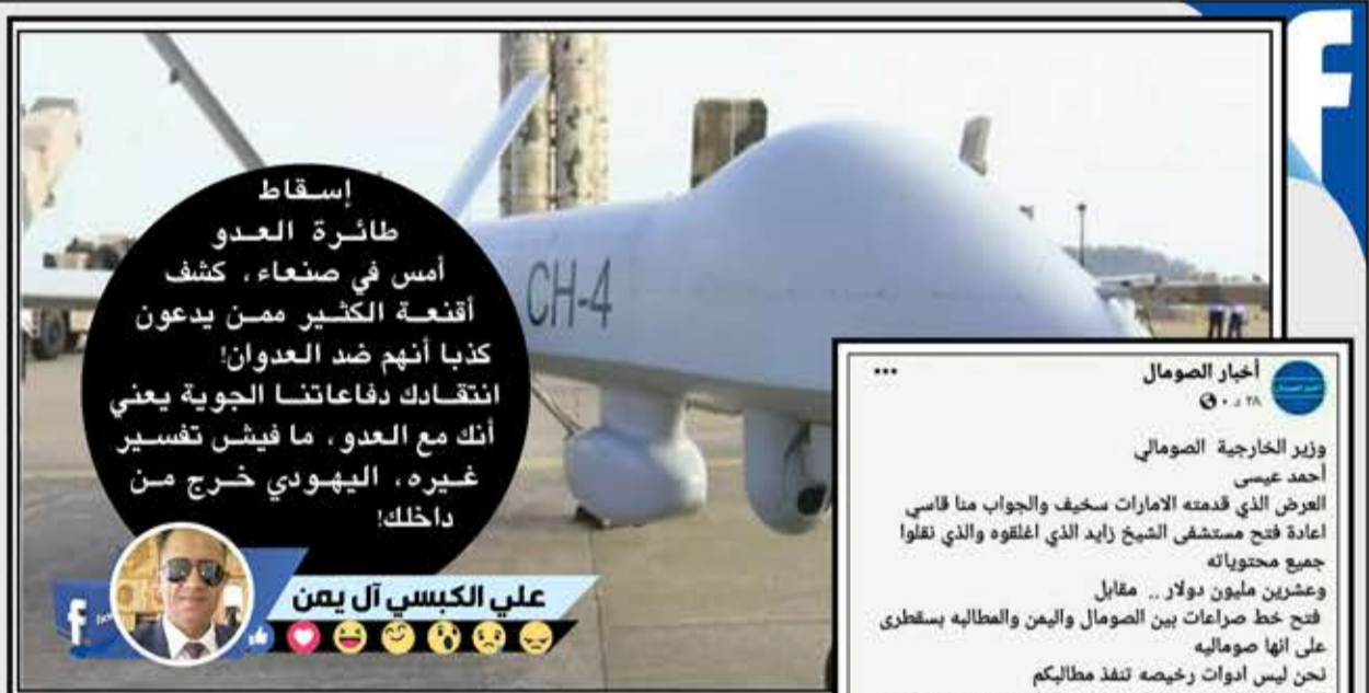
إسقاط طائرة العدو أمس في صنعاء، كشف أفتنة الكثير ممن يدعون انتقادك دفاعاتنا الجوية يعني أنك مع العدو، ما فيش تفسير غيره، اليهودي خرج من داخلك!