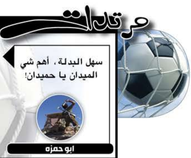
سهل البدلة، أهم شي الميدان يا حميدان! ابو حمزه