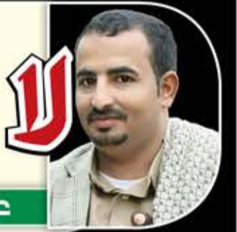
عاقل بن صبر

لا عهد للخائين ولا ذمة لتجار الذمم وسعي واشنطن قرين اهدافها الشيطانية قولوا لها ان البحر الاحمر نار وامواجه حمم والجزر والمد التهامي عاصفة بركانية جنود ابوجبريل وانصاره قمم فوق القمم مصنع هدى القرآن جيل الأمة الربانية