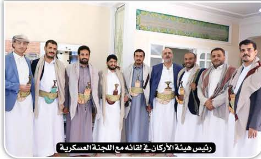
رئيس هيئة الأركان في لقائه مع اللجنة العسكرية