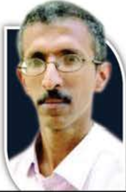
عبد القوي العبيسي

ومن خلال هذه المؤسسة الفنية الضخمة قام باستخدام الوسائط الفنية للترويج، وضخ كمّاً مهولاً من السموم الفكرية كالعنصرية والخرافات الدينية والسحرية التوراتية والماسونية وأفكار شيطنة الآخر المخالف وقيم الاستهلاك وتمجيد العنف والإباحية وأفلام تمجيد وتعظيم الغرب وأفلام مسيسة تدعي التفوق والهيمنة الغربية، أفلام يشاهدها يومياً الملايين من العرب السذج، خاصة جيل الشباب من غير المحصنين بالوعي والثقافة والفكر العلمي النقدي السليم، الذين يتعرضون بشكل شبه يومي لقصف إعلامي ثقافي فكري، ويتجرعون سموماً فكرية مردوخية مدمرة للأذهان.