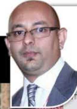
السفير / محمد محمد السادة

بايدن للناخبين الأمريكيين، كما يُعد ورقة أمريكية مهمة لإعادة ثقة الرياض واشنطن. ضف إلى ذلك أنه لا ضمان بعدم تأثر إمدادات الطاقة السعودية بكمياتها الحالية للسوق العالمية دون اتفاق مع صنعاء، ناهيك عن مطالبة واشنطن للرياض بضخ كميات إضافية من النفط، الأمر الذي إن تم سيكون له أثر إيجابي في إعادة ثقة الناخب الأمريكي بالرئيس بايدن وحزبه، لاسيما خلال الانتخابات النصفية القادمة.