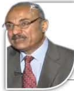
رؤية نقدية بقلم: د. محمد النهاري