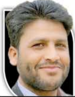
عبد الحميد الفرجاني

بعيدا عن مراعاة الواقع الإنساني لأكثر من خمسة وعشرين مليون إنسان في اليمن، إنما بوصف دور السلطنة ضميما وضامنا لتنفيذ قوى العدوان مجتمعة التزاماتها المختلفة المنصوص عليها في الاتفاق وتعويض تنفيذ ما تنصلت عنه تلك القوى في الأربعة الشهور الماضية. السيناريو الثاني لا يلبي تطلعات اليمن ولا يعالج وضعه، ويتعارض كليا مع كل مواقف اليمن المعلنة سابقا. وفي ضوء ذلك يعني أن الوفد العماني سيحمل رسائل يمنية مزعجة لرباعية العدوان وأن الطرف يفرض اتفاقا أفضل للجميع، وأن وقف الاستعلاء تجاه حقوق اليمن واستحقاقاته ليست تنازلات أمريكية ولا خليجية، بل هي الرافعة لإحياء الهدنة ومد عمرا جديدا لها وأطول من عمرها السابق ولكن عبر صيغة اتفاق جديدة وحيثية تنكئ على أرضية صلبة. وبين السيناريوهات والاحتمالات والخيارات يبقى الثابت أن أي القرارات المتخذة يمنيا مضبوطة بحكمة السيد القائد، وهذا ما يعطيهما الإطمئنان بالنسبة لليمن ويكسبها الرضا الشعبي أيضا من واقع التسليم وتجاربه ونتائجه وحتى نرى إلى أين ستذهب الأمور يطوي سؤال ماذا قرر السيد عبد الملك الحوثي؟ سؤال ماذا حققت جولة بايدين في المنطقة؟ وأيها كانت ردود الفعل على السؤال الأول فما ستقرزه الرياض وأبوظبي وواشنطن ليس ذا قيمة.