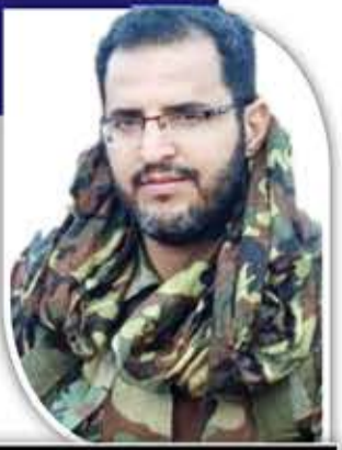
الشيخ صلاح الصلاحي

تعد مسيرة حافلة في تاريخ الجيش، الذي حمل مسؤولية الدفاع عن الوطن بكل شرف وتضحية ووفاء وأمانة، هي أمانة المحافظة على اليمن، كيانا مستقلا، محميا من كل الأخطار والتهديدات. لانزال نحمل هذه الأمانة في عروقتنا، وفي بزاتنا التي تشبعت من دماء الشهداء والجرحى، وعرق العسكريين الصامدين، الشامخين، الأبطال، الذين لا ننحني جباههم إلا لعلم بلادهم. وفيما يقاسي المواطنون معاناة شديدة بسبب الأزمة التي تعصف بوطننا، مناضلين ومكافحين من أجل البقاء، يجدون إلى جانبهم