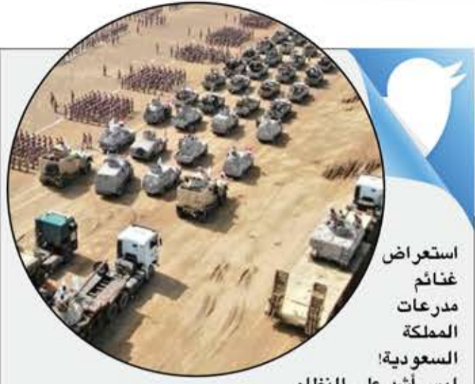
استعراض غنائم مدرعات المملكة السعودية!