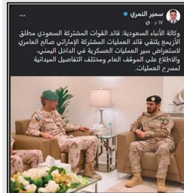
الشيخ/ نبيل المنعي

وكالة الأنباء السعودية: قائد القوات المشتركة السعودي مطلق الأزيمع يلتقي قائد العمليات المشتركة الإماراتي صالح العامري لاستعراض سير العمليات العسكرية في الداخل اليمني، والاطلاع على الموقف العام ومختلف التفاصيل الميدانية لمسرح العمليات.