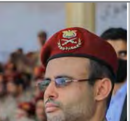
العرض العسكري المهيب «وعد الأخررة» - الحديدة