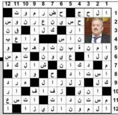
حل الكلمات المتقاطعة