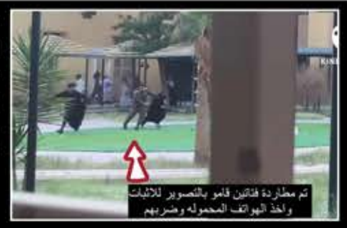
تم مطاردة فئاتين قاموا بالتصوير للفتيات ولأخذ الهواتف المحمولة وضربهم