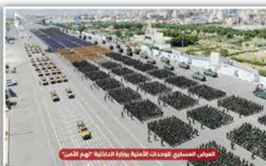
العرض العسكري للوحدات الأمنية بوزارة الداخلية "هم الأمن"