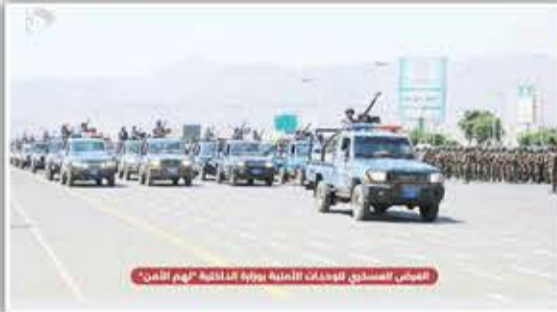
العرض العسكري للوحدات الأمنية بوزارة الداخلية "هم الأمن"