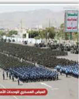
العرض العسكري للوحدات