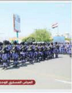
العرض العسكري للوحدات

وأوضح قائد الثورة، في كلمته خلال العرض المهيب للقوات والوحدات التابعة لوزارة الداخلية الخميس الماضي في صنعاء بمناسبة العيد الثامن لثورة 21 أيلول/سبتمبر، أن الأمن ضرورة لاستقرار الحياة ودعمه أساسية للنهضة والبناء، ومن أعظم النعم التي يمن الله بها على عباده. . . لافتا إلى أن الأمن في سلم المسؤوليات ومن أهمها